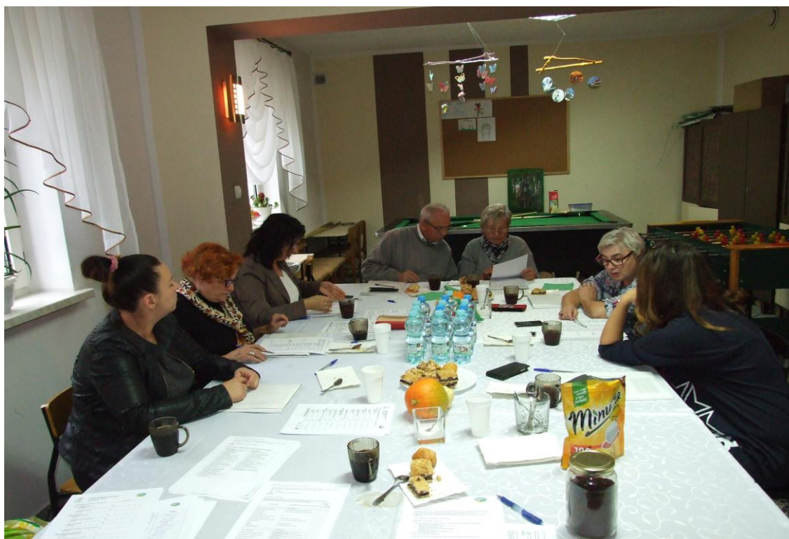
Grupa Odnowy Wsi podczas drugiego dnia warsztatów.