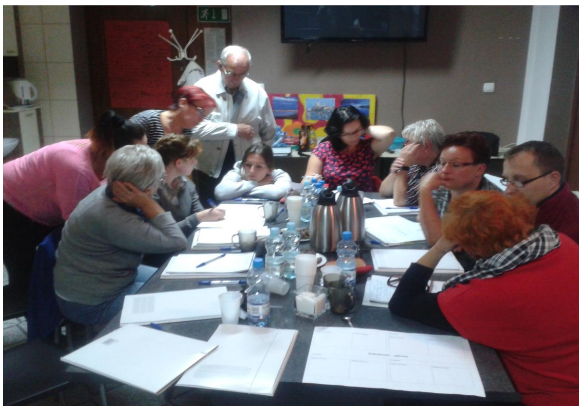
Grupa Odnowy Wsi w trakcie pierwszego dnia warsztatów.