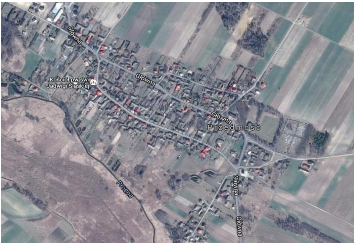
Widok na wieś z satelity.

Przedmość wsią zintegrowanych i aktywnie działających mieszkańców i organizacji, mających do dyspozycji pełne zaplecze sportowo – rekreacyjne. Mieszkańcy mają dostęp do Internetu i wielu atrakcji, korzystają z szerokiej oferty imprez kulturalnych odbywających się w plenerowym „centrum” wsi. Walory przyrodnicze i wykorzystane zasoby przyciągają nowych mieszkańców, powodują wzrost zainteresowania bogatą przeszłością i tradycjami.