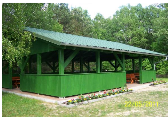
Chatka pod brzożami.