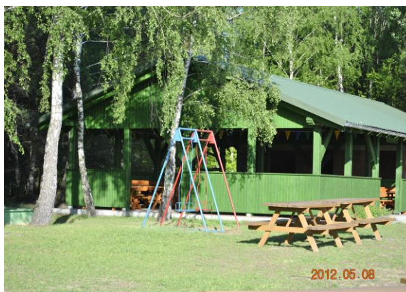
Chatka pod brzożami