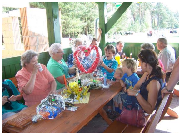
Warsztaty dla dzieci i seniorów.