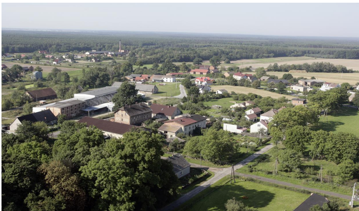
Boroszów. Panorama wsi.