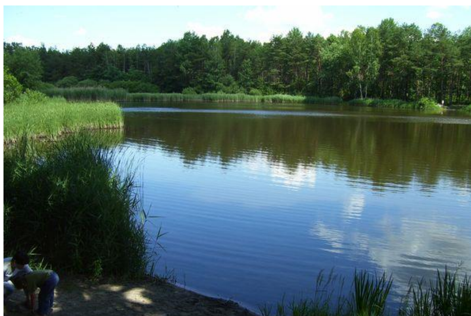
Staw nazywany „Żurawińcem”