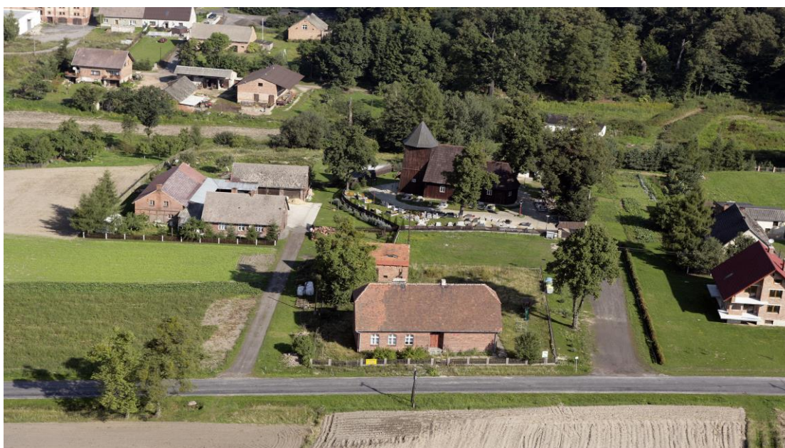
Boroszów. Widok na kościół pw. Św. Marii Magdaleny.