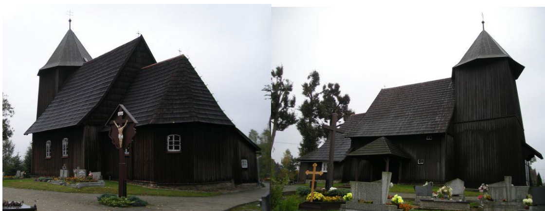
Kościół w Boroszowie